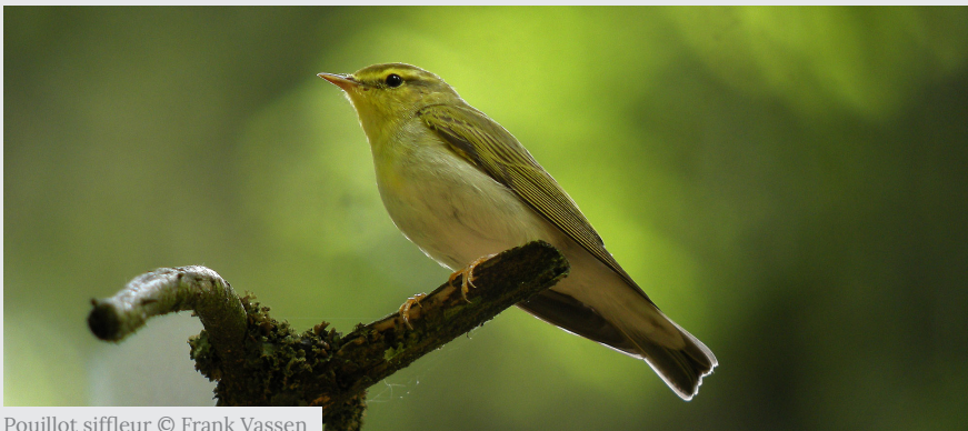
Pouillot siffleur

Le pouillot siffleur et le pouillot de Bonelli, présents en Franche-Comté, nidifient à même le sol des forêts qu'ils occupent. Lors de vos excursions, ne pas sortir des sentiers évite les risques d'écrasement malheureux et le dérangement des oiseaux.